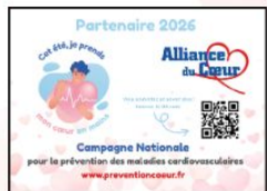
Autocollant Partenaire 2026