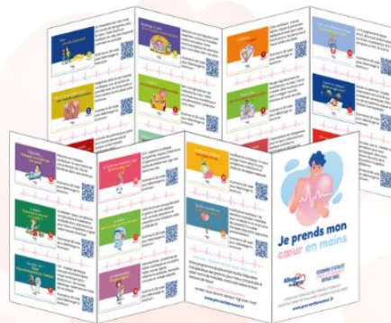
Dépliantes avec QR code